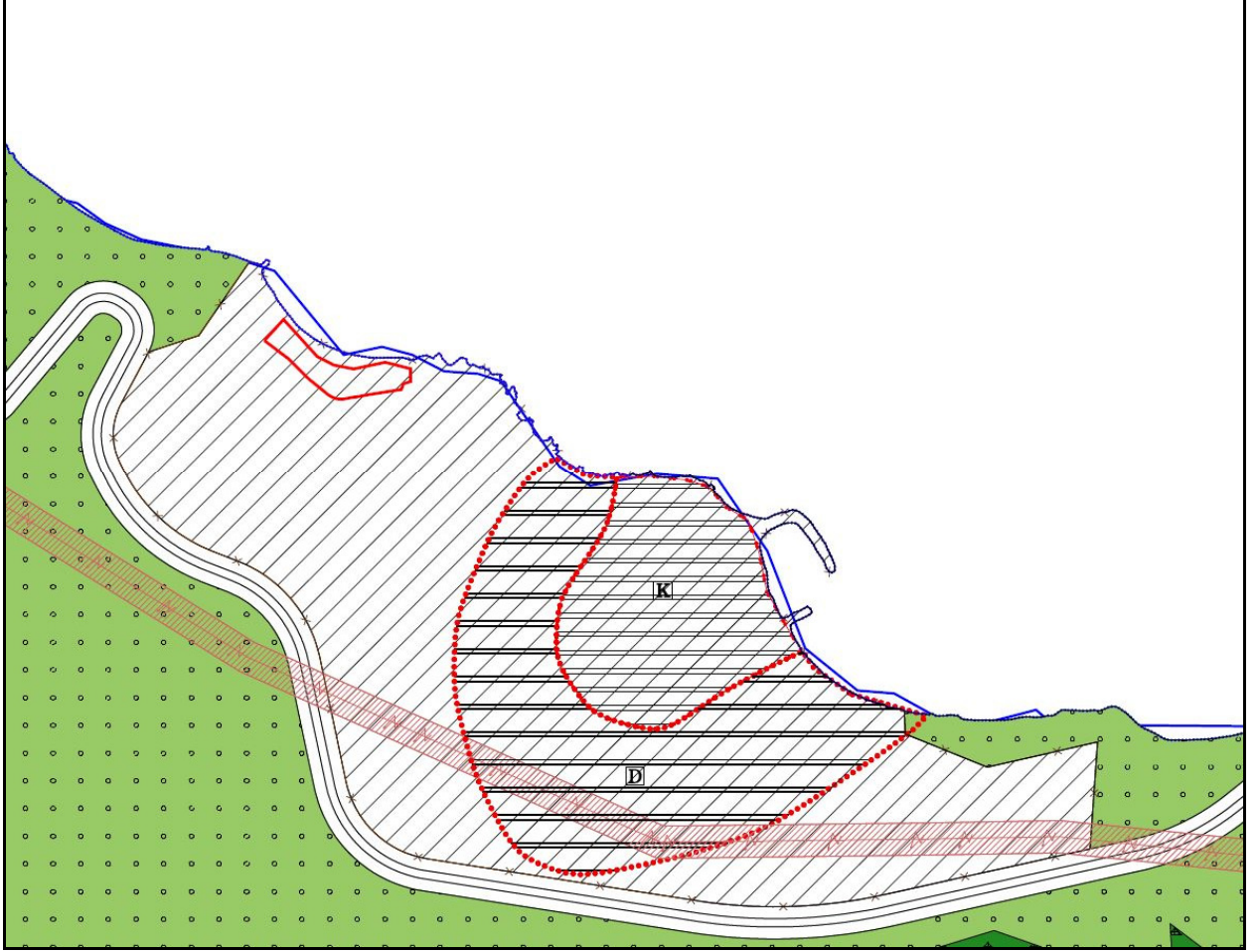
Onaylı 1/5000 ölçekli Kumyaka Köyü ve Çevresi Nazım İmar Planı

Plan değişikliğine konu olan; Mudanya İlçesi, Kumyaka Mahallesi, 1701 ada 2 parsel 1/5000 ölçekli Kumyaka Köyü ve Çevresi Nazım İmar Planında Kırsal Yerleşme Alanı'nda kalmaktadır.